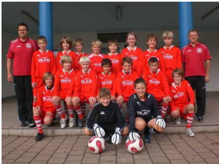
Die D-Junioren 2009/2010 - Bezirk Offenburg- Kreisliga Süd